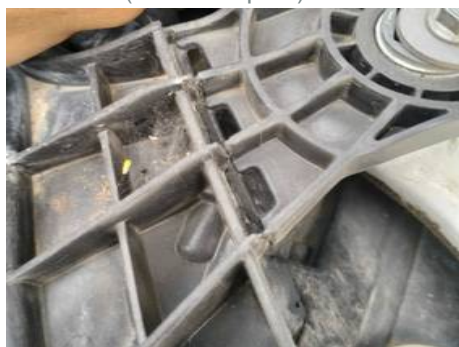
Phare avant droit (Défaut aspect)